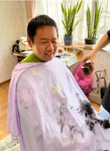
☆格好よくなりました♪

先日も待望の理容師さんが来所されました。マリン・ハウスは整髪しサッパリした利用者様の素敵な笑顔であふれていました。