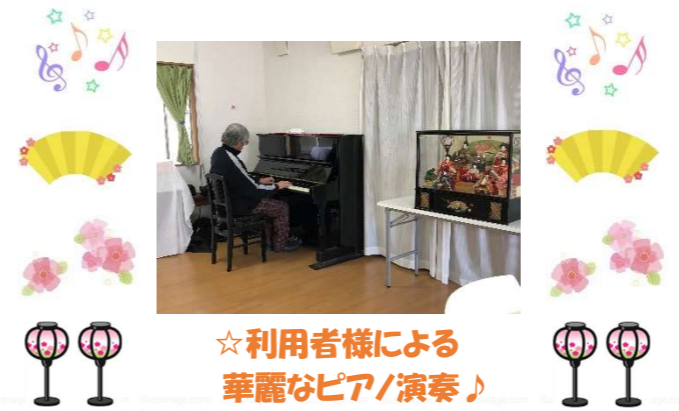
☆利用者様による華麗なピア/演奏♪

さて、ちらし寿司の具材には、それぞれに意味があります。エビには「腰が曲がるまで長生きしたい」という願いが込められています。また、レンコンには「先が見通せるように」、豆には「健康でマメに働けるように」という希望が込められています。皆様にも、ちらし寿司の御利益が舞い降りますように・・・